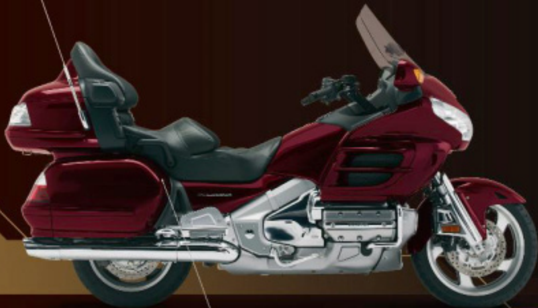
Cabernet red metallic