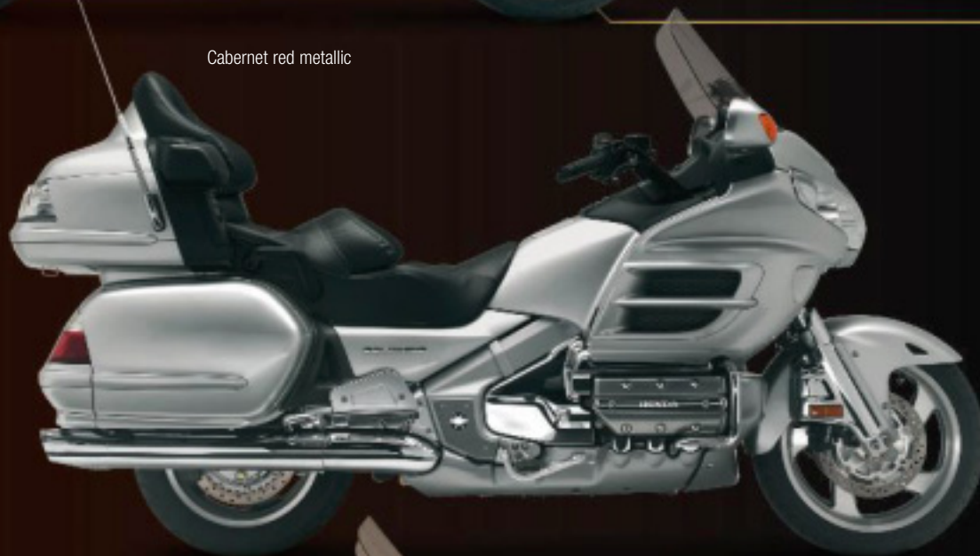
Billet silver metallic