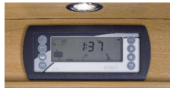
| LUXUS Digitales Bord-Control-Panel