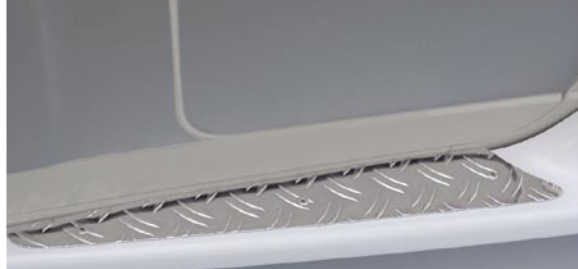
I LUXUS Trittschweller