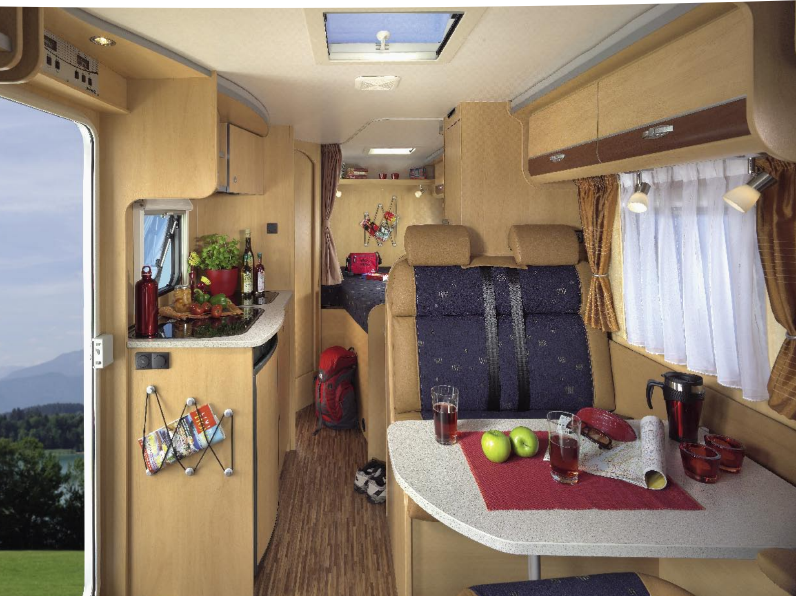
I Teilintegriert 2 / BASIC / TEXAS