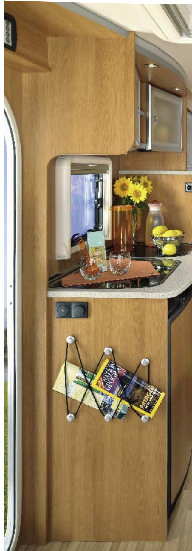
I Integriert 1 / LUXUS / MONTANA