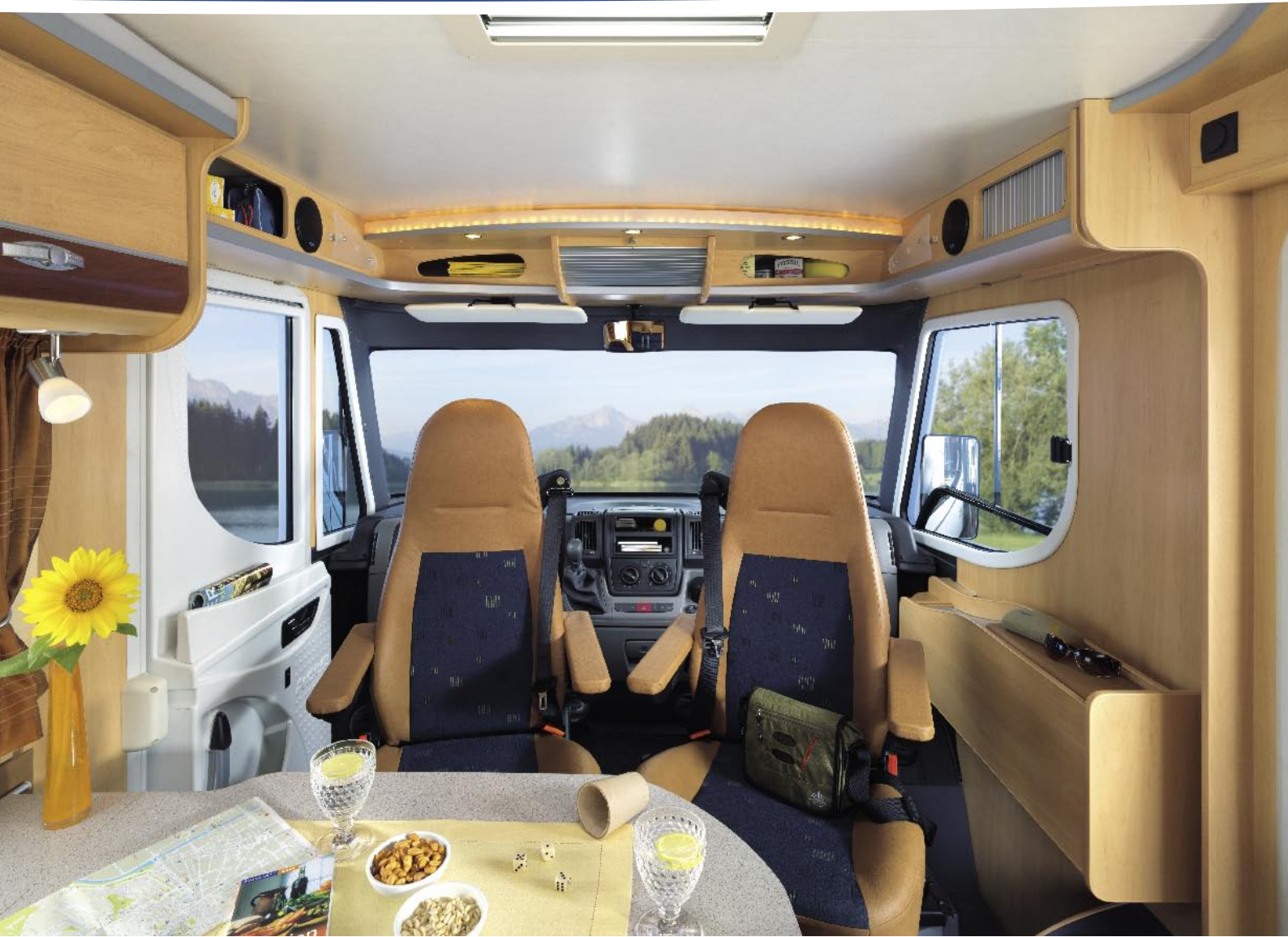
| Integriert 1 / LUXUS / TEXAS