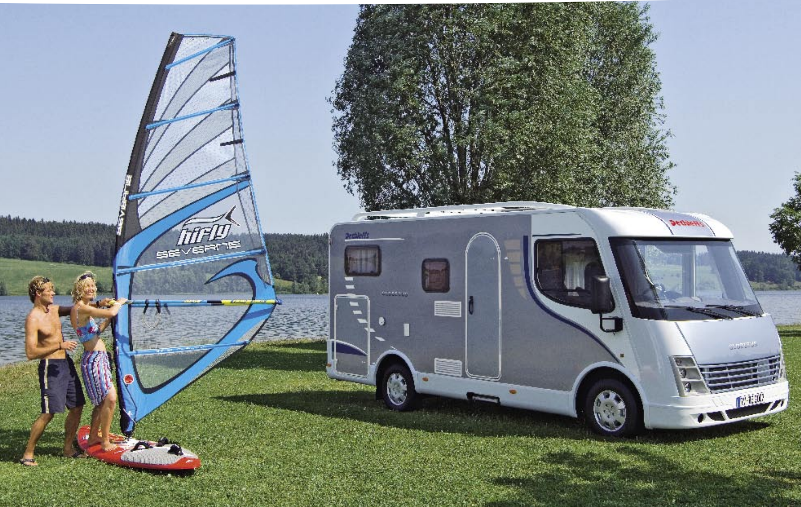
| Integriert 1 Polarblau: Das Leben einfach mal laufen lassen – das ist ein schönes Ziel.