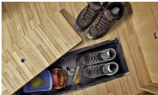
| Praktisches Bodenfach optional