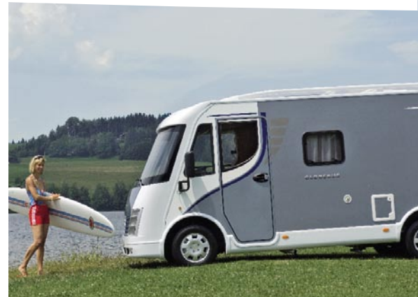
| Integriert 1 Polarblau

Neue Horizonte entdecken, unter dem Himmel Halt machen... Wer sich Träume erobern will, nimmt selten den geraden Weg. Der GLOBEBUS jedenfalls ist dabei und schafft selbst enge Stellen problemlos. In der kompakten Form eines Kastenwagens, mit angenehm überschaubaren Maßen, aber mit dem Komfort eines multifunktionalen Motorcaravans. Als Teilintegrierter, wie ihn begeisterte Weltenbummler kennen – und jetzt sogar als integriertes Modell, GLOBEBUS Integriert. Mit dem straffen Tiefrahmen-Chassis fährt der GLOBEBUS sich so unkompliziert wie ein großer Van. Selbst Betten, Isolierung, Küche und Badezimmer stammen aus dem Baukasten der großen Dethleffs Motorcaravans. Nur der Preis ist bewusst klein. Weil wir wissen, dass die Welt unfassbar groß ist und wir Ihr Budget gern schonen. Auch so ist Ihr Freund der Familie!