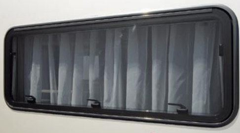
I LUXUS Rahmenfenster