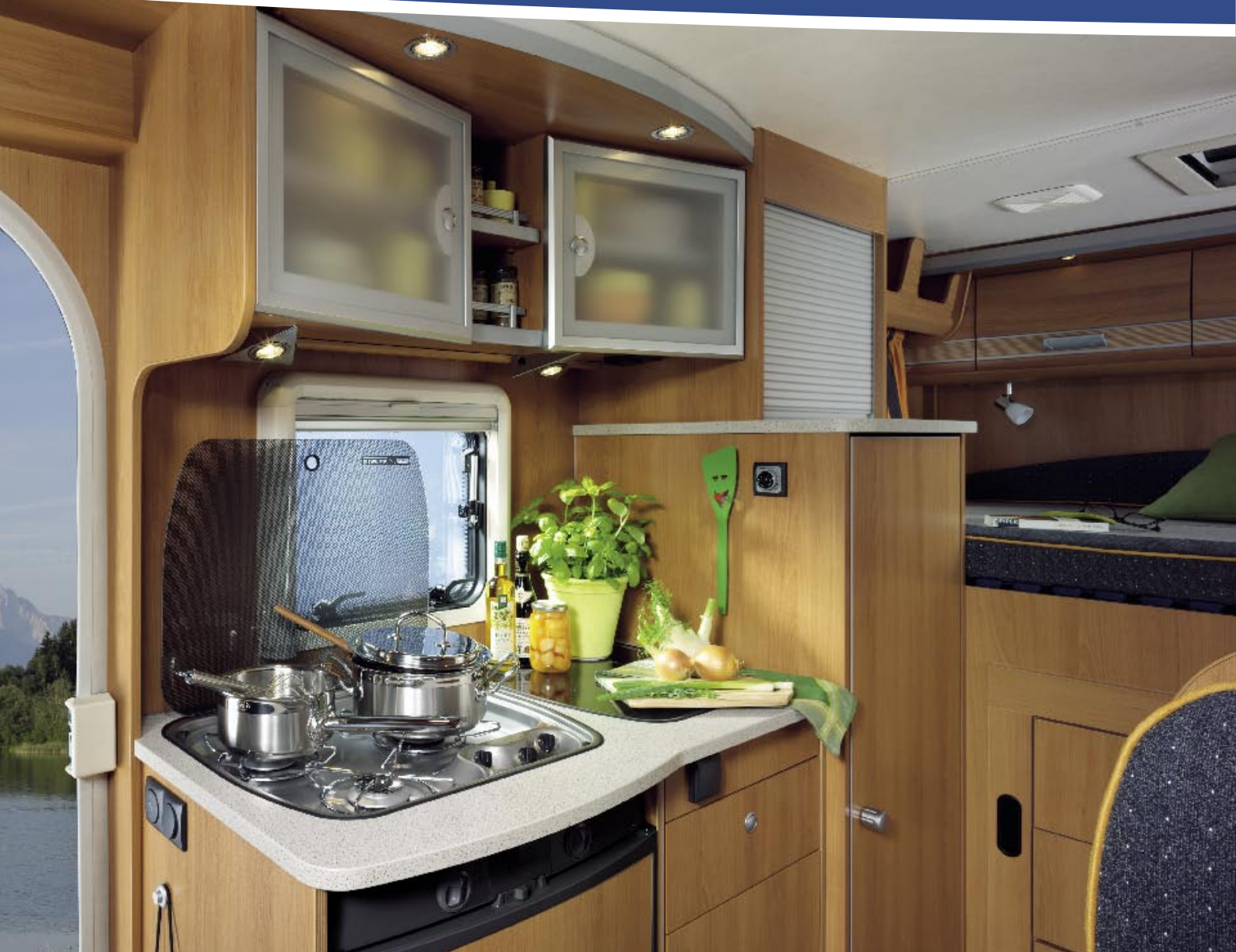
| Teilintegriert 1 / LUXUS / MONTANA