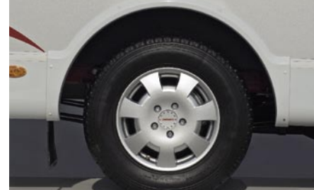
I LUXUS Alufelgen