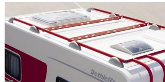
I LUXUS Dachträger