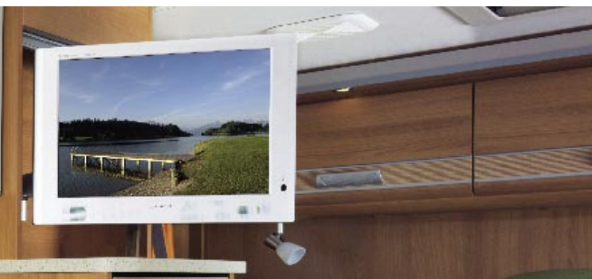
| Schwenkbare Flachbildschirmhalterung optional