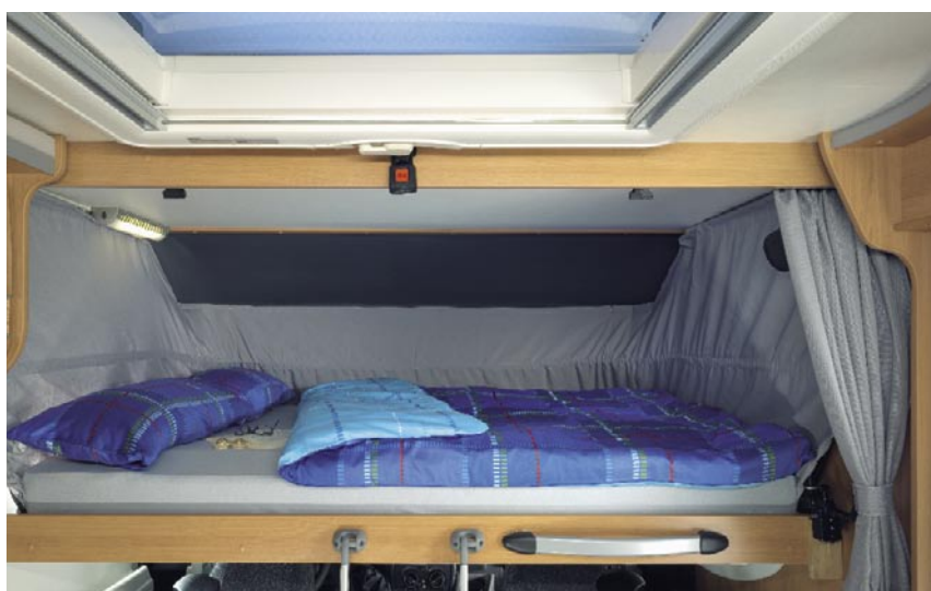
| Hubbett mit komfortabler Federkernmatratze