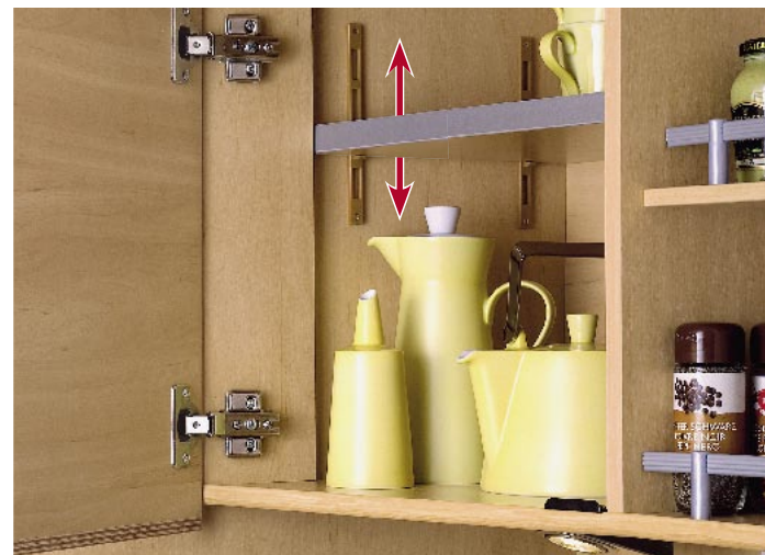
I Höhenverstellbare Fachböden

etwa, die Kleiderschrank-Innenbeleuchtung oder die neue Travel-Lounge, eine Sitzbank mit verstellbarer Lehnenneigung. So sitzen Sie während der Fahrt aufrecht – und vor Ort bequem. Die Travel-Lounge ist gegen Aufpreis bei vielen Fahrzeugen mit Bar-Grundriss lieferbar (nicht Globebus 3).