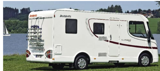
| Integriert 2 Weiß