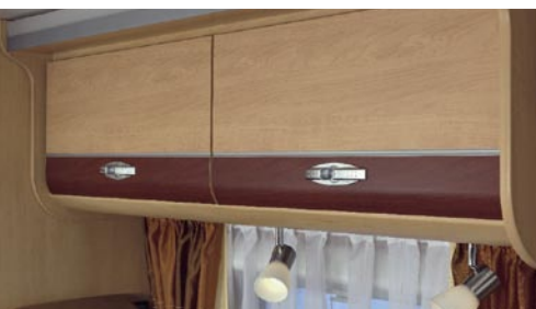
| BASIC Tessiner-Apfel