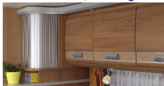
| LUXUS Vienna-Birne