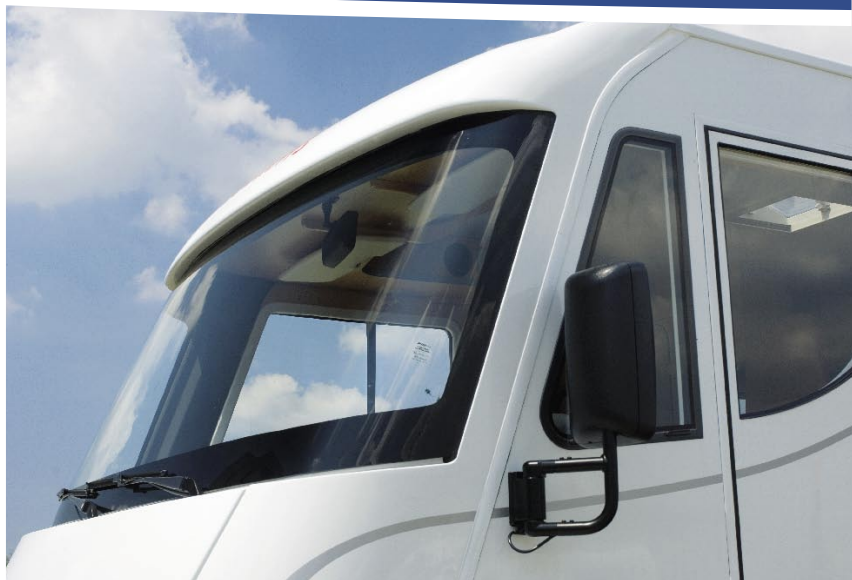
| Große Panoramasscheibe 1

Ein unbeschreiblich entspanntes Fahrerlebnis genießen – das ist mit dem GLOBEBUS Integrierten und der herrlich großen Panorama-Frontscheibe ganz leicht. Schließlich gilt der GLOBEBUS Integrierte als günstigster und kompaktester Einstieg in die Königsklasse. Auf Wunsch mit an Bord: das Hubbett mit einer geräumigen Liegefläche von 190 x 140 cm – zwei zusätzliche Schlafplätze, selbstverständlich mit komfortabler Federkernmatratze.