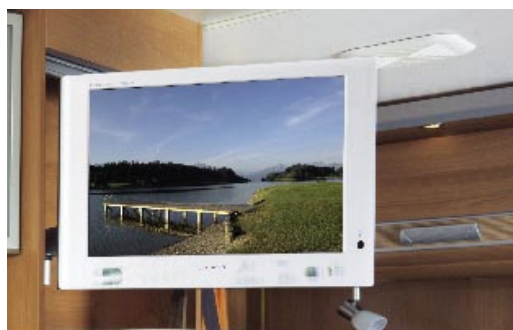
| Schwenkbare Flachbildschirmhalterung optional