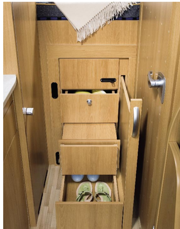
| GLOBEBUS 1 2